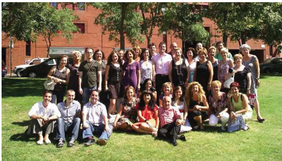
Personal de l'Acadèmia durant el dinar d'estiu de juliol de 2009