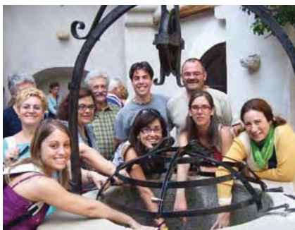
Fotografies corresponents al viatge del personal a Romania (2005)