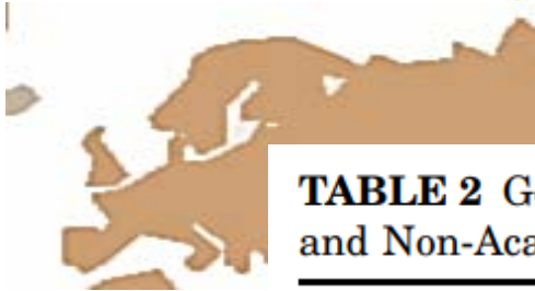
TABLE 2 Gerontological Education Programs in Europe: Sorted by Academic and Non-Academic Degrees