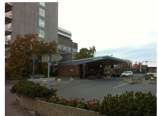
Medizinische Hochschule Hannover